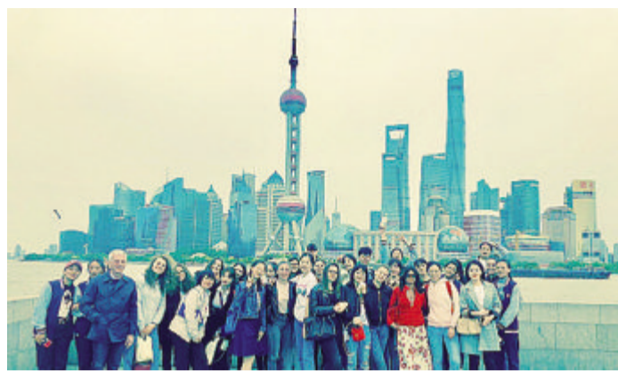
La delegazione di studenti e professori lodigiani ospitata in Cina